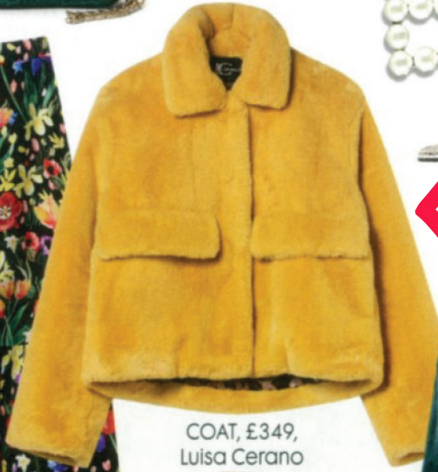
COAT, £349, Luisa Cerano