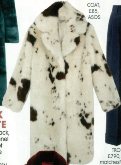
COAT, £85, ASOS