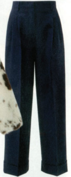
TROUSERS, £790, Fendi at matchesfashion.com