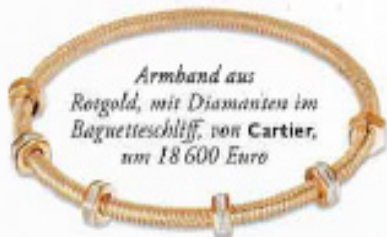
Armband aus Rotgold, mit Diamanten im Baguetteschliff, von Cartier, um 18 600 Euro