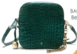
BAG, £135, Bell & Fox