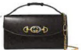
Umhängetasche „Zumi“ aus Leder, von GUCCI, um 2300 €