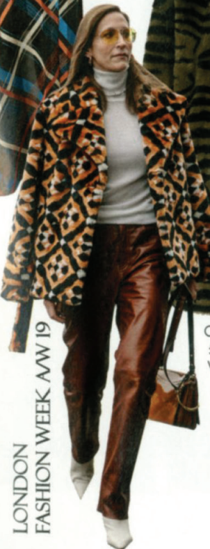
COAT, £85, Very