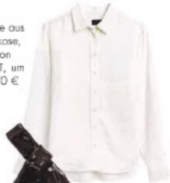
Bluse aus Viskose, von GANT, um 170 €