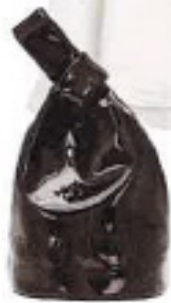
Bucket Bag aus Lackleder, von JIL SANDER, über mytheresa.com, um 550 €