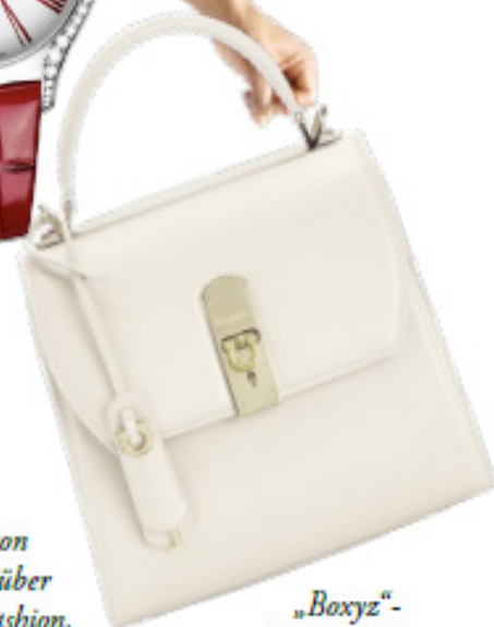
„Boxyz“- Henkeltasche von Salvatore Ferragamo, 1690 Euro.