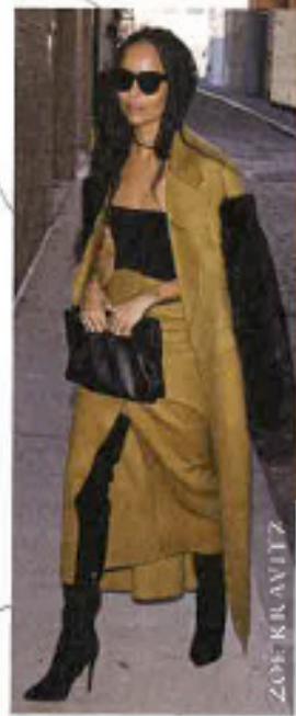
BOTTEGA VENETA Tasche aus Leder, um 3800€