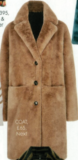
COAT, £65, Next