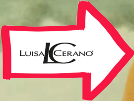
Sandra Hüller, Bochum 2019 Rollkragentop aus Velvet Mesh mit schwarzen Paspeln, um 200 €, von LUISA CERANO . Kegel-BH aus Latex, um 245 €, von ATSUKO KUDO .