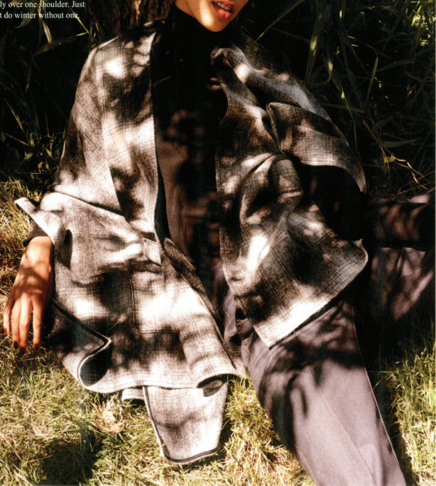
PONCHO, £339; ROLLNECK, £155; JEANS, £229, all Luisa Cerano

Most of us would jump at the chance to spend the colder months wrapped up in a blanket – and this winter you can, with the emergence of the wool poncho as the fashionable cover-up of choice. The poncho (not to be confused with the smarter, more tailored cape) is adding a bohemian edge to everything, so drape it, belt it or just sling it grandly over one shoulder. Just don't do winter without one.