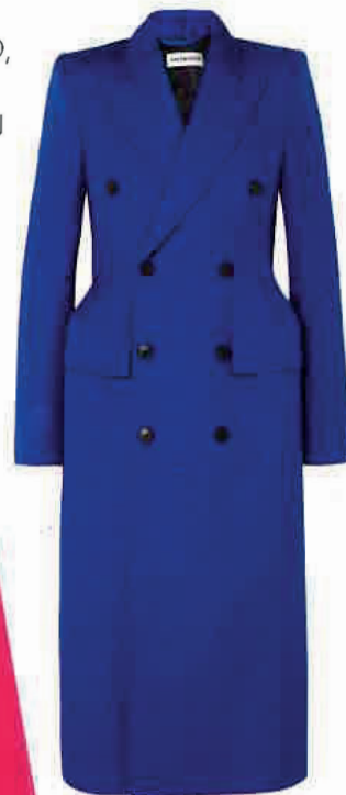
Kabát, BALENCIAGA (PARIŽSKÁ 17), 58 990 Kč