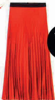
Sukně, LUISA CERANO , 8 190 Kč