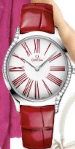
Uhr „De Ville Trésor“ mit Diamanten von Omega, 4100 Euro.