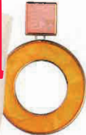
Náušnice, H&M , 399 Kč