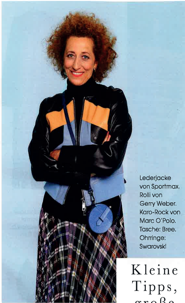
Lederjacke von Sportmax. Rolli von Gerry Weber. Karo-Rock von Marc O'Polo. Tasche: Bree. Ohrringe: Swarovski