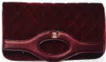
Clutch aus Samt und feinem Lammlleder, von Chanel, um 1500 Euro