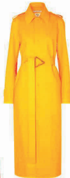
Kabát, BOTTEGA VENETA (PARIŽSKÁ 17), 52 500 Kč