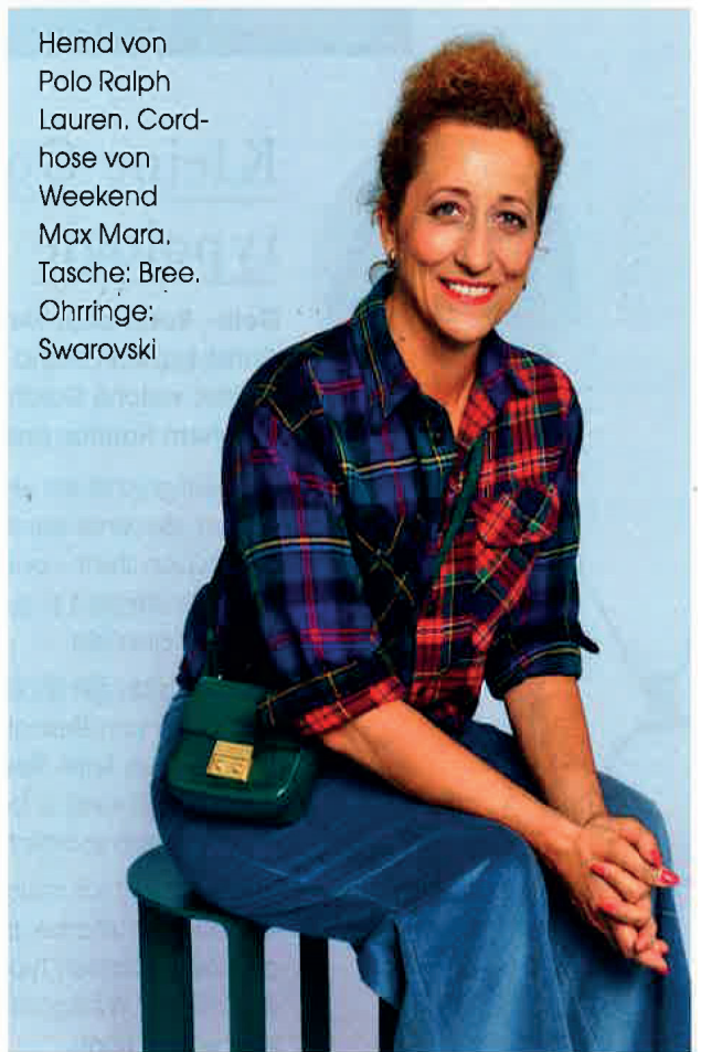
Hemd von Polo Ralph Lauren. Cordhose von Weekend Max Mara. Tasche: Bree. Ohrringe: Swarovski