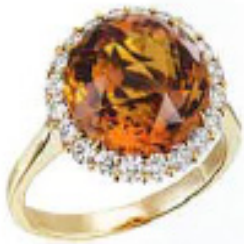
Gelbgoldring mit Diamanten, von FH Trautz, Preis auf Anfrage