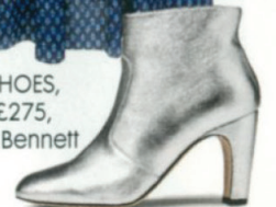
SHOES, £275, L.K. Bennett