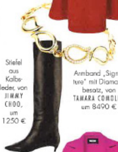
Armband „Signature“ mit Diamantbesatz, von TAMARA COMOLLI, um 8490 €