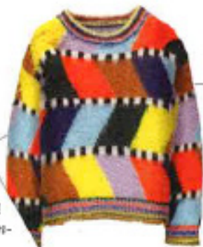
ESSENTIEL ANTWERP Pullover aus Mohair- mix, um 265 €