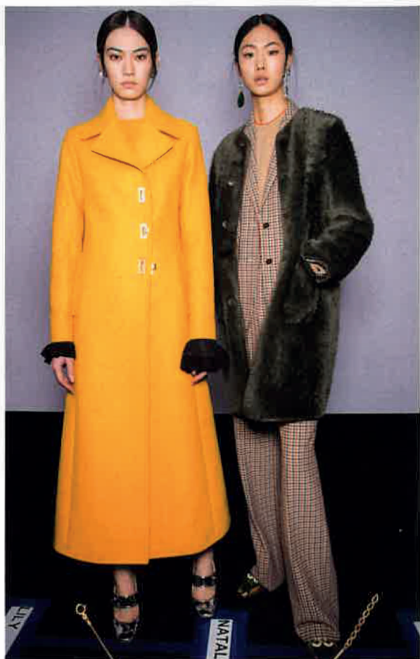
Kabát, BALENCIAGA (PARIŽSKÁ 17), 73 790 Kč

ČERNÝ KABÁT UŽ DOMA URČITĚ MÁTE! TEĎ JDE O TO, DOSTAT DO VAŠEHO ZIMNÍHO ŠATNÍKU ŠPETKU BAREV. JAKOU JE LIBO?