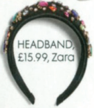
HEADBAND, £15.99, Zara