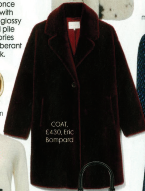
COAT, £430, Eric Bompard