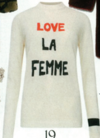
JUMPER, £310, Bella Freud