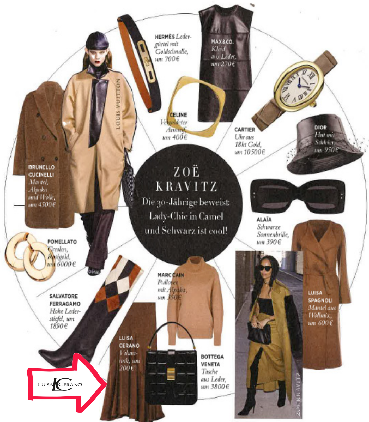
HERMÈS Leder- gürtel mit Goldschnalle, um 700€