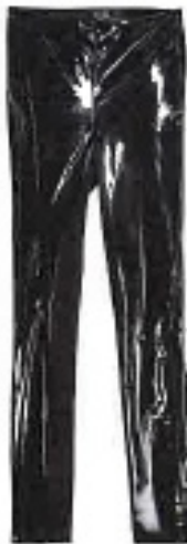
Hose aus Vinyl, von KARL LAGERFELD, um 195 €