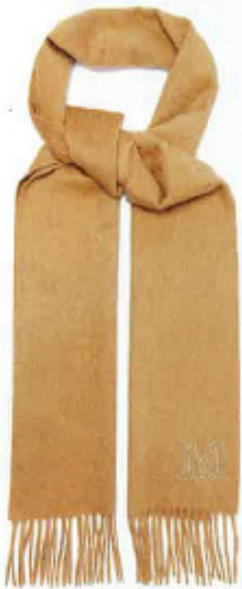
Cashmere-Schal mit aufgesticktem Logo, von Max Mara, um 250 Euro