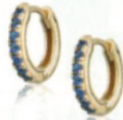
EARRINGS, £30, Scream Pretty