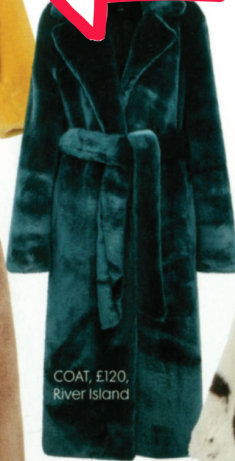
COAT, £120, River Island