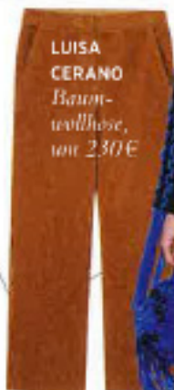
LUISA CERANO Baum- wollhose, um 230 €