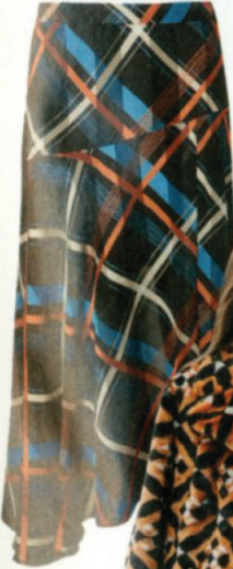
SKIRT, £14, George

The furry classic is back, and it's time to channel your inner Margot Tenenbaum once more. Wear with eclectic florals, glossy metallics and pile your accessories high for an exuberant winter look.