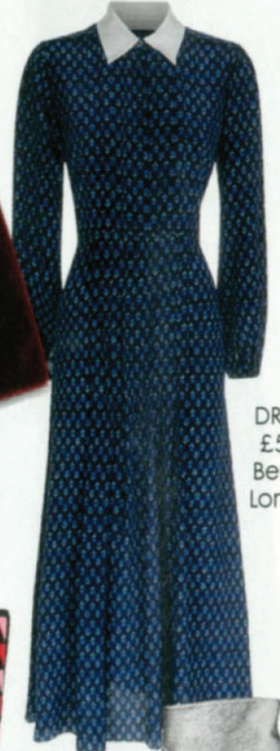
DRESS, £525, Beulah London