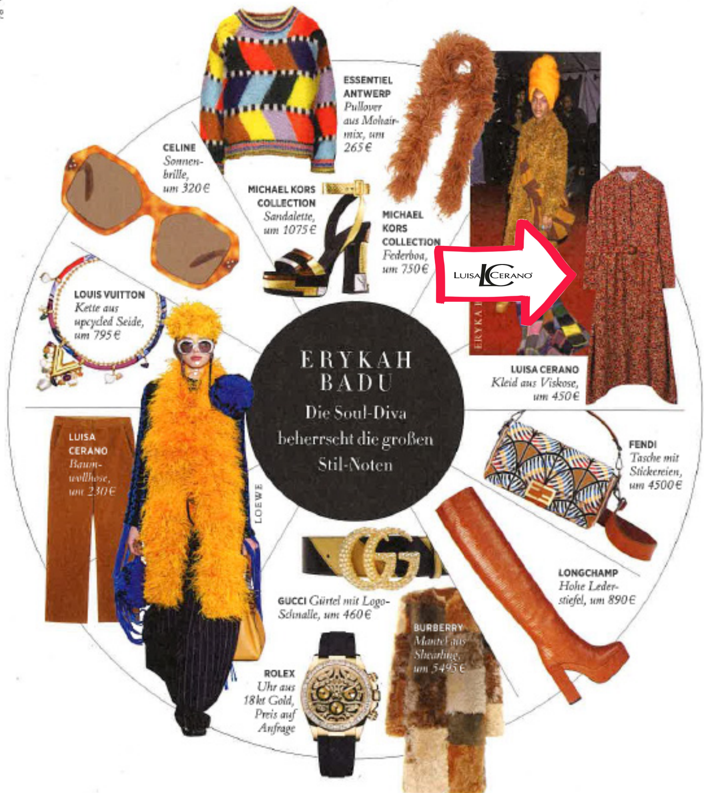
CELINE Sonnenbrille, um 320 €