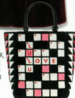
BAG, £225, Lulu Guinness