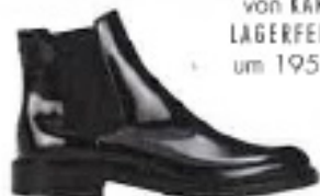
Chelsea Boots aus Lackleder, von SAINT LAURENT, über mytheresa.com, um 795 €