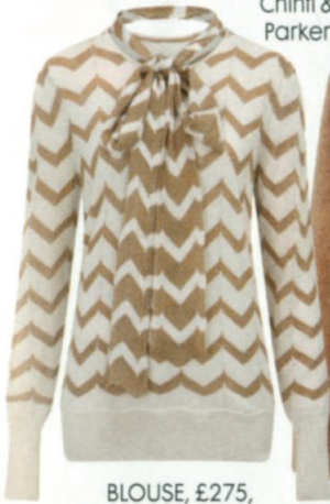
BLOUSE, £275, Tabitha Webb